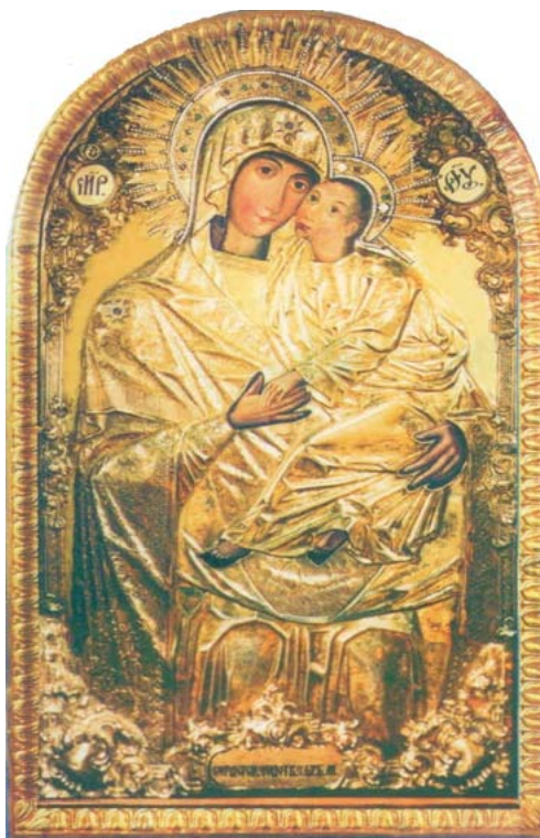
СУРДЕГСКАЯ ИКОНА БОЖИЕЙ МАТЕРИ (Каунасский Благовещенский собор)